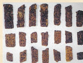
鉄製品 (芋引金・鉄斧・その他)