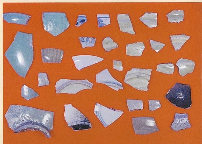
中国産の中世陶磁器 (青磁・白磁・染付)